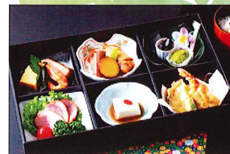
※お料理写真はイメージです