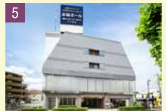
5 板橋区 赤塚 千代田赤塚ホール 東京都板橋区赤塚新町3-3-8 ☎03-5967-3451